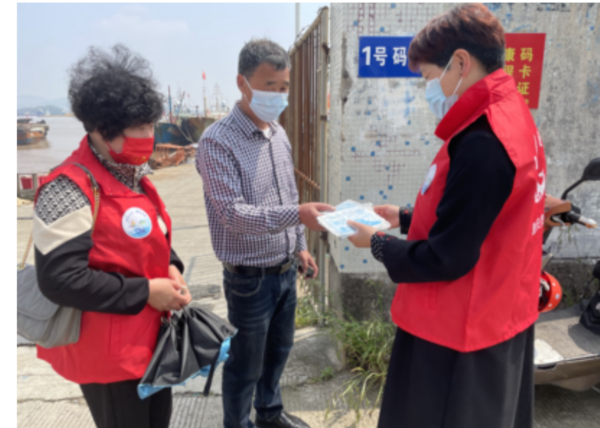
白泉镇日前组织“东海渔嫂”来到辖区码头，向渔民宣传安全生产和疫情防控知识，进一步提高他们的安全意识。